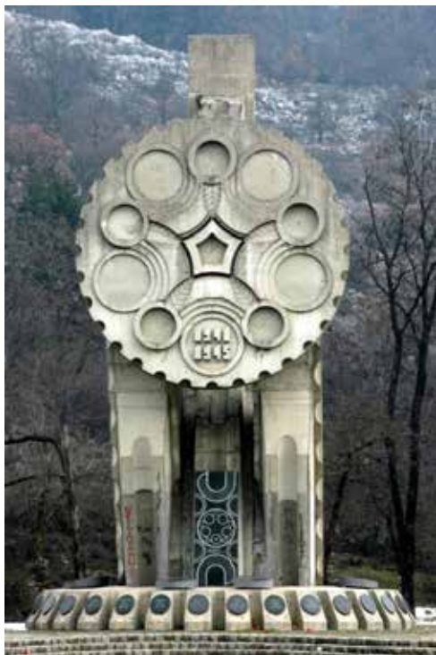
Spomenik Palim borcima pod Trebjesom - detalj centralnog motiva - ornamentalni disk