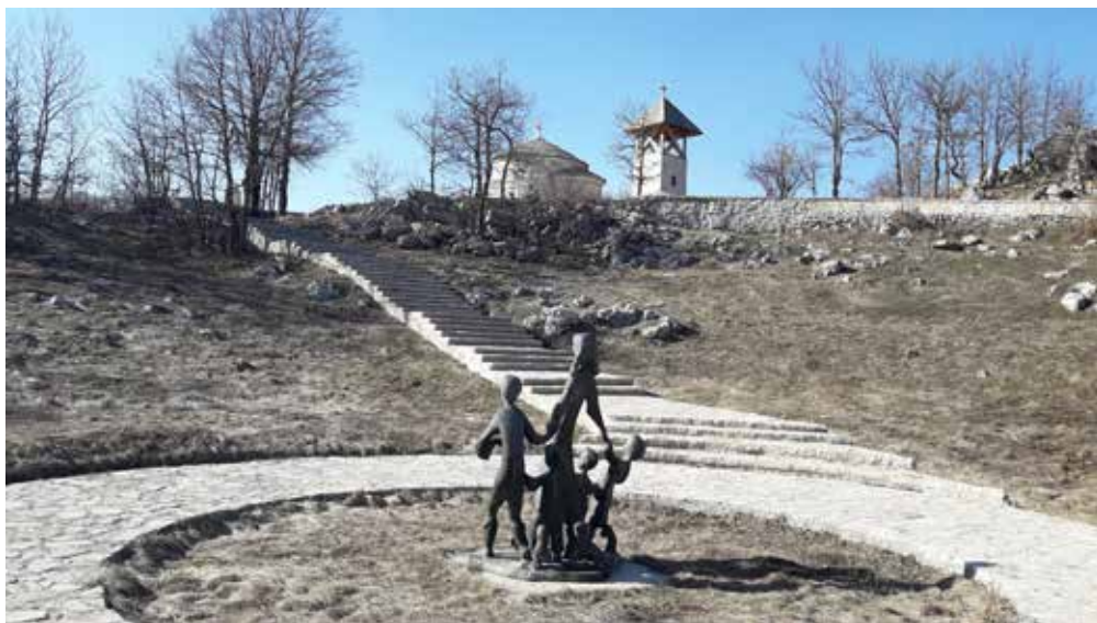
Memorijalni kompleks „Dola“ (sakralni objekti u pozadini su dodati kasnije i nisu dio originalanog izgleda spomeničkog kompleksa)