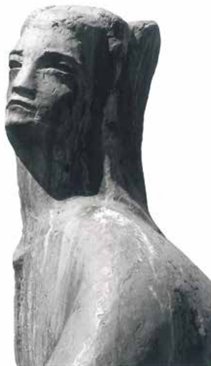
Skulptura u bronzi - „Tužbalica“

Investitori spomen-kompleksa su bili uglavnom stanovnici sela Miljkovca i Opština Plužine, a posebno srodnici postradalih. Pored spomenika je 2011. godine izgrađena manja pravoslavna crkva posvećena Svetom Jovanu Krstitelju 2 , a 2016. godine je dodat i drveni zvonik (Eparhija budimsko-nikšićka). Dominantan materijal sakralnih objekata je kamen, a gornji dio zvonika je urađen u drvetu. Podaci o stradanju koje je povod izgradnje memorijalnog kompleksa su napisani iznad ulaza u crkvu. Na glavnom putu Nikšić-Plužine postoji saobraćajna info-tabla na kojoj je naznačeno skretanje za spomen-kompleks „Dola“. Spomenik se kontinuirano posjećuje i održava, a posebno na dan stradanja poginulih 7. jun. 3