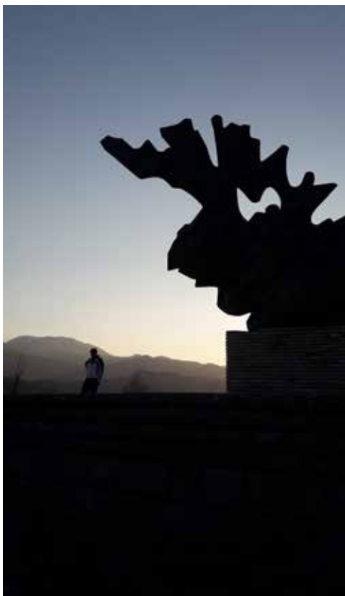
Spomenik palim borcima u Grabovu

(Grahovo, Jasikovac, Trebjesa, Virpazar – Bar), što se zapravo odnosi na prvobitnu markaciju spomen-lokaliteta, prije izgradnje spomenika, dok preostala 4 (Dola, Barutana, Žabljak, Spomen-dom u Kolašinu) nijesu na Listi. Indikativno je da, jedan od regionalno i internacionalno najprepoznatljivijih i najpoznatijih spomenika u Crnoj Gori (Barutana – Podgorica) nije na ovoj Listi, već se samo nalazi u Registru spomen-obilježja opštine Podgorica, što je svakako i jedan od razloga njegovog trenutno vrlo zapuštenog stanja. Spomen-dom u Kolašinu, kao arhitektonski objekat, takođe nije zaštićen.