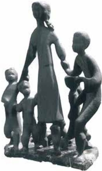
Skulptura „Majka sa djecom” (U krilu bronzane majke)

ukazujući na cjelokupne porodice koje su stradale na ovom mjestu. Od te primarne skulpture koja dočekuje posjetioca, uskim betonskim stepeništima formirana su spuštanja ka udolinama, i na desnoj i na lijevoj strani od pristupnog platoa. Daljim kretanjem kroz prostor dolazi se do skulpture u bronzi – U krilu bronzane majke – figure majke sa četvoro djece različitih uzrasta, koje majka pokušava da zaštiti u trenutku naglo prekinute dječje igre. U ovom skulpturalnom obilježju, vajar Tomanović primjenjuje poseban psihološko-figurativan pristup kroz koji iskazuje osoben lirski senzibilitet. Defomisane i rastočene konture dječjih tijela iskazuju naivnu dječju razigranost, prisutnu bez obzira na ratne strahote, ali istovremeno simbolizuju i veliki bol i strah kroz koji djeca prolaze. U nastavku kružnog kretanja kroz kompleks, dolazi se