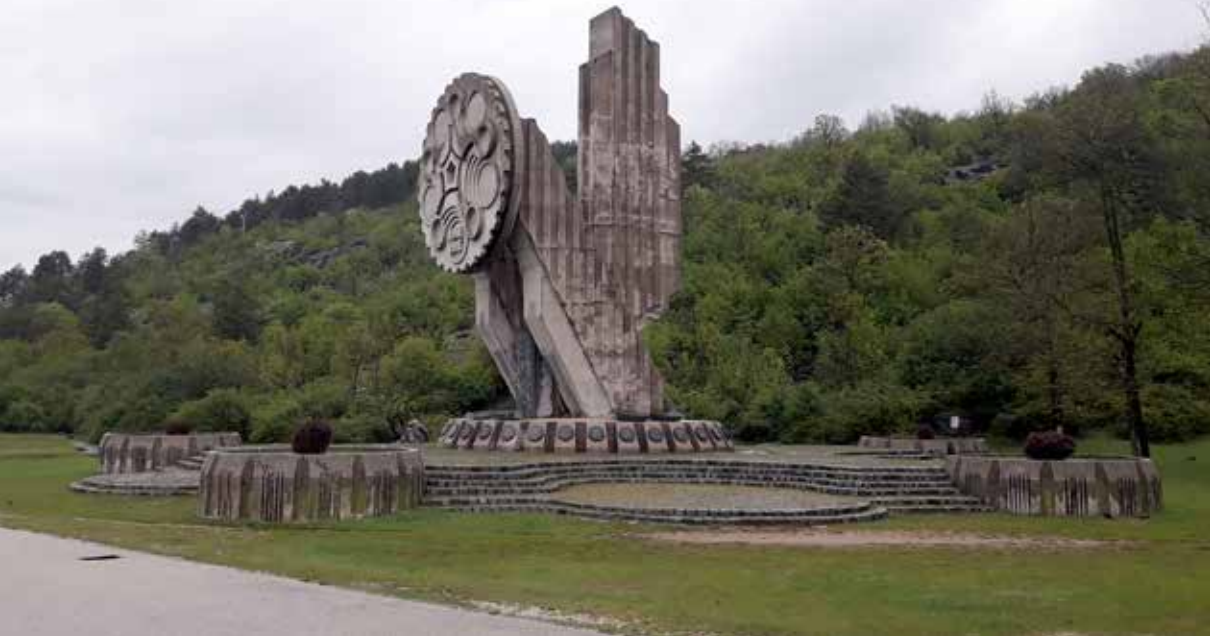
Spomenik Palim borcima pod Trebjesom, Nikšić

se i Saborna crkva Svetog Vasilija Ostroškog (1899), Dvorac kralja Nikole (1900), kao i