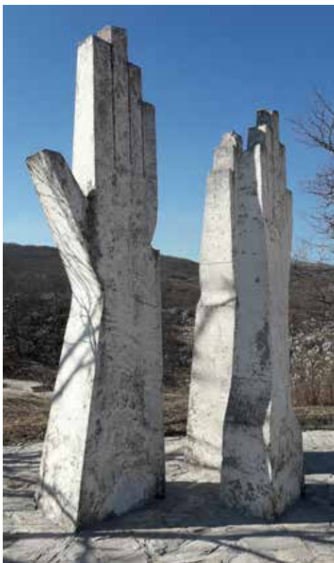
Memorijalni kompleks „Dola“ - skulptura „Ruke“

Memorijalni kompleks „Dola“ je podignut u znak sjećanja na postradale stanovnike Župe pivske, a najvećim dijelom sela Miljkovac (među njima najviše iz bratstva Blagojevića), koje su 7. juna 1943. godine ubili pripadnici fašističke Sedme folksdojčerske SS divizije „Princ Eugen“. Napad na Pivski kraj dogodio se tokom V ofanzive (operacije „Schwarz“/ „Crno“) i Bitke na Sutjesci, koja se od kraja maja do polovine juna 1943. godine odvijala u jugoistočnoj Bosni na granici sa Pivom i tadašnjim durmitorskim srezom. U Dolima je u jednom danu ubijeno 522 stanovnika, od čega 109 djece 1 , a jedna