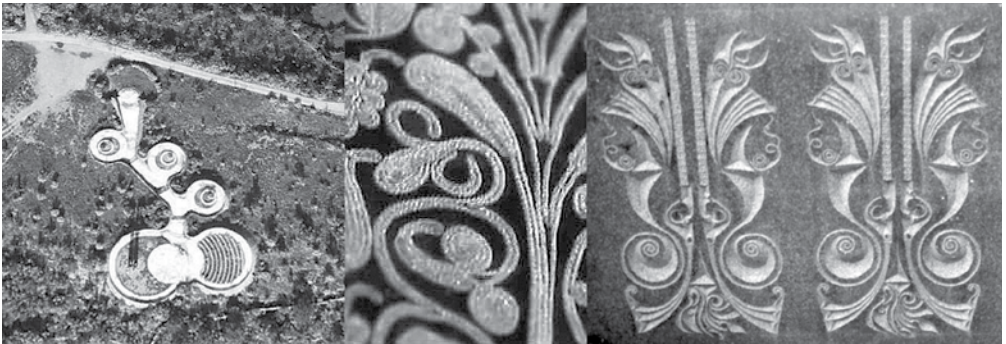
Prisustvo tradicionalne ornamentike: spomenik na Barutani (lijevo), ornament sa narodne nošnje (sredina), spomenik na Jasikovcu (desno)

Iako je, iz svih pomenutih razloga, značaj ove knjige nesumnjiv, njen glavni cilj je prepoznavanje spomenika posvećenih II svjetskom ratu, njihova valorizacija i afirmacija kao važnog segmenta cjelokupnog kulturnog nasljeđa Crne Gore, pa time i njihova promocija kao šireg, regionalnog kulturno-turističkog proizvoda tj. dijela kulturnih ruta jugoistočne Evrope. U tom smislu, ova knjiga tek pokreće ovu značajnu temu i sigurno će dobiti svoj adekvatan nastavak kroz neke buduće oblike valorizacije i afirmacije.