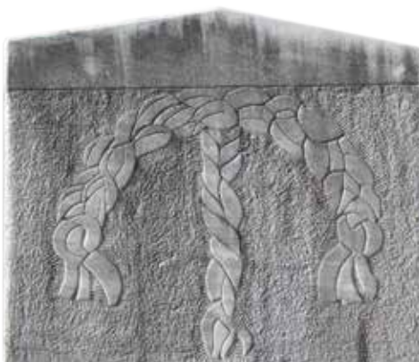
Spomen ploča - stela - ženska kosturnica

Izgradnja spomen-kompleksa otpočinje idejnim procesom tokom 1975/76. godine, a završava se 1977. godine, neposredno nakon izgradnje Pivske hidrocentrale i formiranja vještačke vodene akumulacije - Pivskog jezera, kada je i Pivski manastir izmješten na drugu lokaciju.