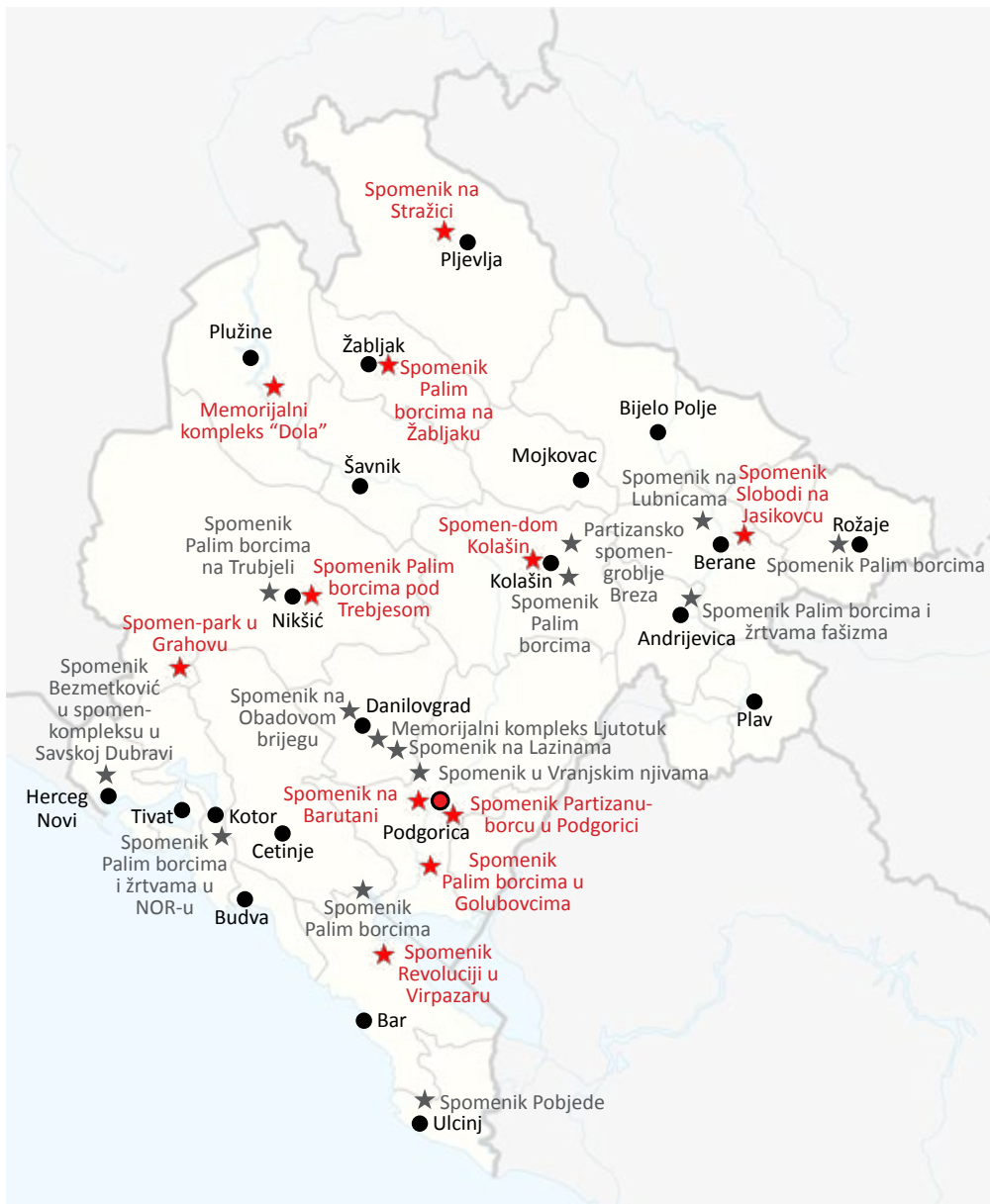
Prikaz spomenika na mapi Crne Gore