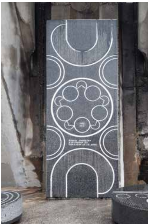
Spomenik Palim borcima pod Trebjesom - detalj

i horizontalno razvijenom postamentalnom podnožju.