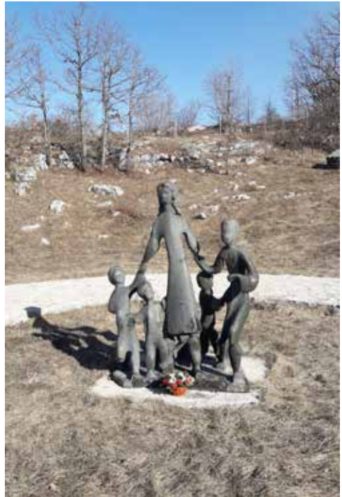
Memorijalni kompleks „Dola“ - skulptura „Majka sa djecom“

Spomen-kompleks „Dola”, bez imena poginulih, postavljen je u netaknutoj prirodi i sastoji se od četiri spomenička dijela u kojima se nalazi po jedan centralni skulpturalni motiv, a koji prostorno i simbolički kreiraju jednu cjelinu: Ruke (dim. ~ 3x3m), Majka sa djecom (poetski naziv „ U krilu bronzane majke ”, dim. ~ 1.5x2m), Spomen-ploča – stela , ženska kosturnica (dim. ~ 0.8x1.7m) i Tužbalica - muška grobnica (dim. ~ 1x2m). Nakon ulaska u spomenički kompleks, najprije se nailazi na skulpturu u betonu – Ruke , u bijeloj boji, koja je postavljena na najvišoj koti, betonskom platou sa koga se vide udoline (doli) u kojima se, na različitim mjestima, nalaze ostala tri skulpturalna obilježja. Skulptura Ruke se sastoji od tri otvorene šake uzdignute prema nebu, različitih dimenzija, koje predstavljaju ruke muškarca-oca, žene-majke i djeteta, odnosno zajedno kreiraju jasan simbol porodice,